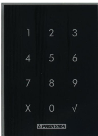
Рис 2. Лицевая панель клавиатуры.

4.1 Клавиатура поставляется в металлическом корпусе для крепления на плоскую поверхность. Лицевая панель клавиатуры выполнена из акрила. Клавиатура поставляется в двух вариантах цвета лицевой панели – черном и белом. Внешний вид лицевой панели (черной) показан на рис.2.